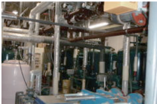
機械室ろ過装置配管