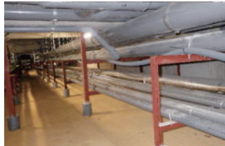
地下ピット循環配管