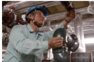
配管メンテナンス作業