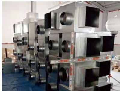
チャンバーボックス受入検査

「快」という漢字は、心が開けて晴々とする様を表します。大建の空調設備事業部門がお届けするのも、青空の下で深呼吸をするような快適さ。建物内での冷暖房空調設備や換気設備、福祉施設等の空調設備や大型冷凍冷蔵庫設備などの設計・施工を通して、快適な心地よさを求める現代社会のニーズに最新の技術と多くの実績、信頼のサービスでお応えしています。