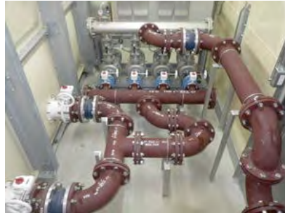
受水槽ポンプ室内部給水配管

「恵」とは、心を宿す「人」と関わること。慈しむこと。大建では、水の恵みに感謝し、人と地球環境を慈しみながら暮らしに潤いをお届けしています。ご提供するの、戸建住宅からビルまであらゆる建物の水道・排水設備、各種住宅器具設備の設計・施工など、清潔で使い勝手の良い水廻り設備。また、増加する温浴施設のクリーンで効率的な給湯システムや巨大地震にも負けない給・排水管への免震継手の施工など、新技術の研究開発にも努めています。